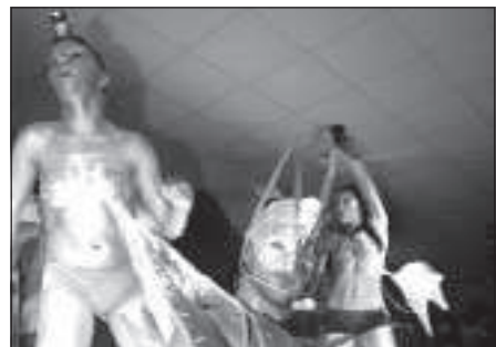
A sinistra l'animazione del «24» a destra il leggendario Little Louie Vega

Nell'attesa, stasera prende il via la stagione musicale del nuovo locale di via Battisti a Latina: il Central Kitshcen .