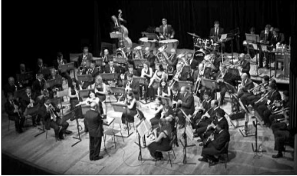
In alto l'orchestra di fiati «Rossini» di Latina A sinistra il regista Ugo Gregoretti A destra Eduardo De Filippo

Domani, dalle 17.30 alle 20, ci sarà la tombolata a premi per bambini e alle 21 Gran Concerto dell'Orchestra di Fiati «Rossini» di Latina. La giornata si conclude con una polentata a cura dell'associazione «Palazzoni» e con il concerto di tamburi e percussioni dal vivo del gruppo