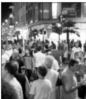
Alcuni momenti delle passate edizioni della Notte Bianca

Matteotti (da viale XXVI Maggio a piazza del Popolo), via Diaz, via Carducci, piazza del Mercato, il parcheggio di piazza della Libertà, via Oberdan, via Farini, via Battisti, via F.lli Bandiera, via Neghelli, via Lago Ascianghi, via Adua, via Pisacane, via Emanuele Filiberto, piazza San Marco, via Gramsci, via Costa, via Pio VI, via Cattaneo, via Giuliani, via Sisto V, via Cialdini, via Carlo Alberto, via Eugenio di Savoia, via Duca del Mare. Parte dei divieti saranno attuati anche per l'intera giornata di domenica soprattutto nella zona di piazza San Marco.